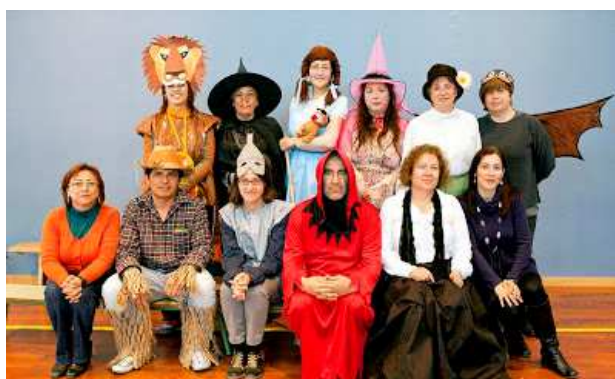
Puesta en escena de "El maravilloso mago de Oz", curso 2012/13